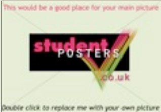
Figure 1: Insert a good image of your endangered or threatened species in the space above. Add your caption here: